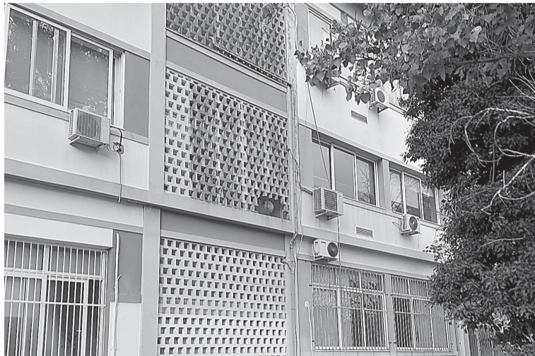
☛ Το κτίριο Β