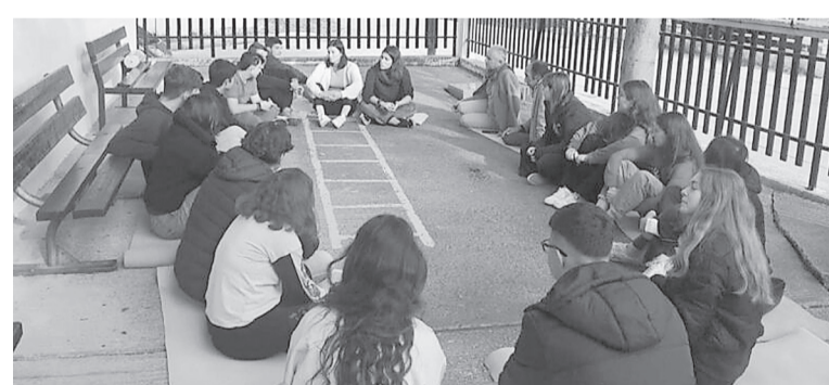
☛ Το ατυχές γεγονός δεν χαρακτηρίζει τη λειτουργία του σχολείου

Ο τίτλος μπήκε πολύ εύκολα για το επεισόδιο βίαιης συμπεριφοράς μεταξύ δύο μαθητών του ΕΝΕΕΓΥΛ (Ενιαίο Ειδικό Επαγγελματικό Γυμνάσιο Λύκειο) Πάτρας. «Επεισόδιο ξυλοδαρμού», «Συμμορίες ανηλίκων που έχουν σπείρει τον φόβο και τον τρόμο» «Περιστατικό bullying μεταξύ μαθητών» και πολλοί άλλοι ακόμα. Σε τι βαθμό, όμως ανταποκρίνονται αυτοί οι τίτλοι στην πραγματικότητα; Οι διδάσκοντες στο ΕΝΕΕΓΥΛ που δίνουν καθημερινά τη μάχη της εκπαίδευσης παιδιών με αναπηρίες, εκ των οποίων αρκετά με πολλαπλές, μέσω της «Π», περιγράφουν την κατάσταση. «Θα θέλαμε, με αίσθημα ευθύνης και σεβασμού στους μαθητές μας, στους γονείς τους και στους εκπαιδευτικούς που πασχίζουν καθημερινά για τη λειτουργία της δημόσιας εκπαίδευσης και συγκεκριμένα της Ειδικής Εκπαίδευσης, αλλά και για την ενημέρωση των πολιτών και την αποκατάσταση της αλήθειας, να σας αναφέρουμε τα εξής: ☛ Σε ένα ειδικό σχολείο που φοιτούν μαθητές με αναπηρίες ή/και ειδικές εκπαιδευτικές ανάγκες (πολλοί μαθητές μας έχουν πολλαπλές αναπηρίες), είναι επιστημονικά ανεπίτρεπτο να μιλάμε για "bullying" και "συμμορίες". Αυτό που στην πραγματικότητα συμβαίνει είναι ότι η διαταραχή/ιδιαι-