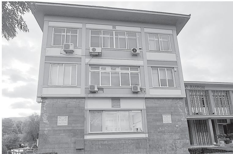
☛ Το κτίριο Α